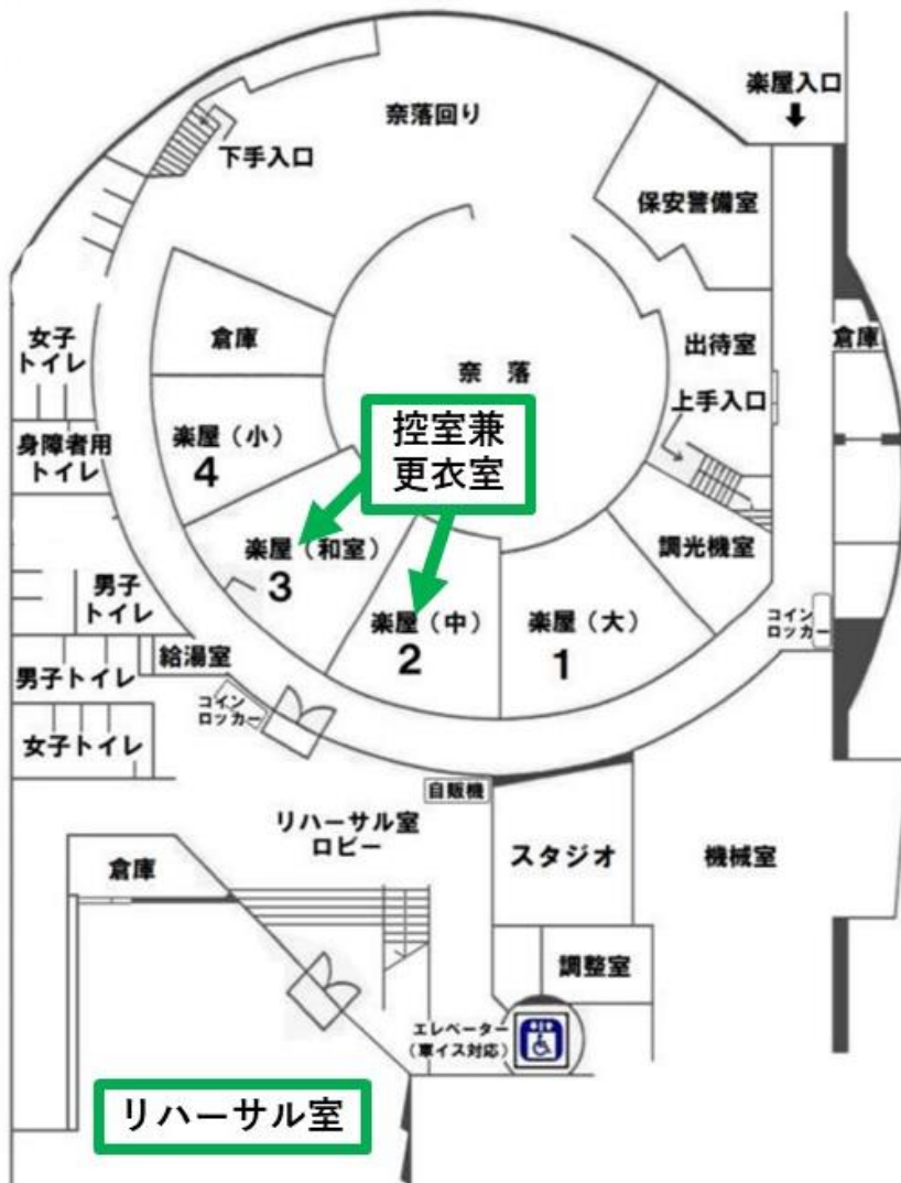
市民シアター 地下1階 楽屋・リハーサル室 平面図

リハーサルはコンテスト部門のみ行います。ご了承ください。 リハーサル時間は1:00~2:00を目安といたします。エントリー数によって変動いたしますので、エントリー締め切り後の本番1週間前の最終要綱のご連絡をお待ちください。 リハーサル終了後は自由行動となります。イベント開始頃または出演時間までにお戻りください。 またリハーサル室は自由に使用いただいて構いません。各チーム通し練習を行った後、他チームがいる場合は必ず譲りあいながらご利用ください。※場所は下記図参照